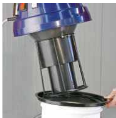
Hlava motora s plavákom