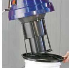
Hlava motora s plavákom